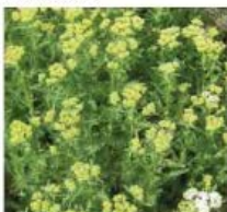
Achillea crithmifolia Achillée crithmifolia