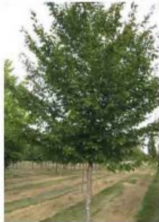
Carpinus betulus Charme