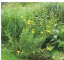
Achillea millefolium 'Dante'