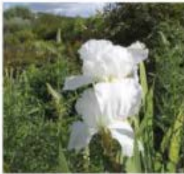
Iris barbata eliador 'Immortality' Iris barbus