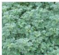
Artemisia 'Powis Castle' Armoise arborescente