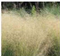
Descampsia cespitosa Canche cespitose