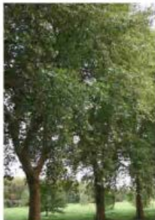
Platanus x acerifolia Platane