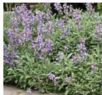
Salvia officinalis Sauge officinale