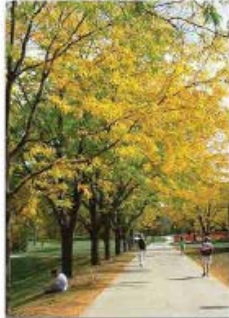
Gleditzia triacanthos 'Inermis' Févier d'Amérique (Automne)