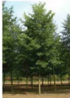
Koelreuteria paniculata Savonnier