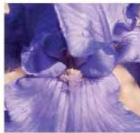
Iris barbata elatior 'Crystal Blue' Iris