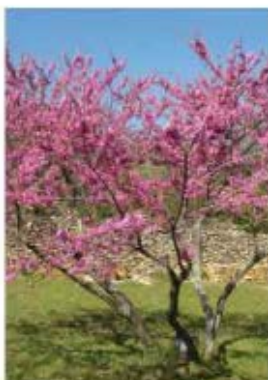
Cercis siliquastrum Arbre de judée