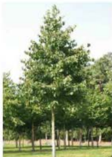
Corylus colurna Noisetier de Byzance