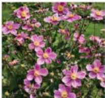
Anemone hepatica 'Praecox' Anémone