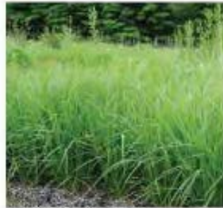
Carex muskingumensis Carex