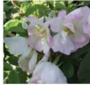
Rosa rugosa Rosier rugueux