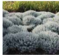
Santolina chamaecyparissus Santoline