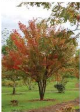
Koelreuteria paniculata Savonnier (Automne)