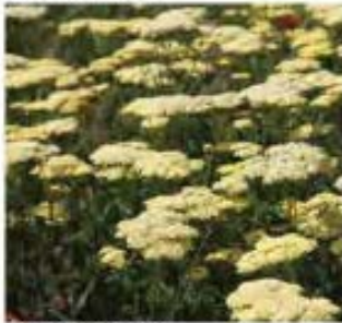
Achillea 'Credo' Achillée