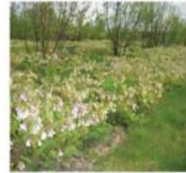
Symphytum grandiflorum Consoude