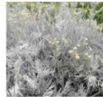
Senecio vira Séneçon