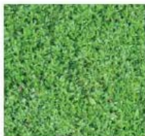
Phyla nodiflora Verveine nodiflore