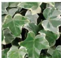
Hedera helix 'Clivii'