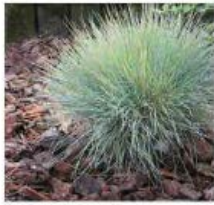
Festuca glauca cinerea Fétuque bleue