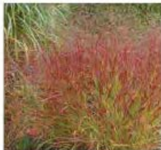
Panicum virgatum 'Rehbraum' Panicum