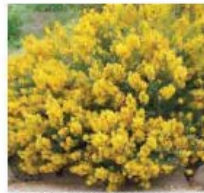
Genista pilosa 'Vancouver Gold' Verveine dorflöre