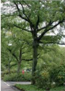
Gleditzia triacanthos 'Inermis' Févier d'Amérique