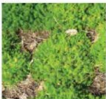
Chamaemelum nobile Camomille romaine