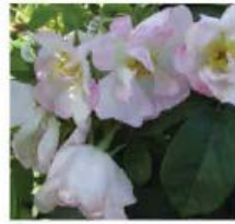
Rosa rugosa Rosier rugueux