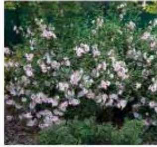
Lavatera X Barnsley Santoline