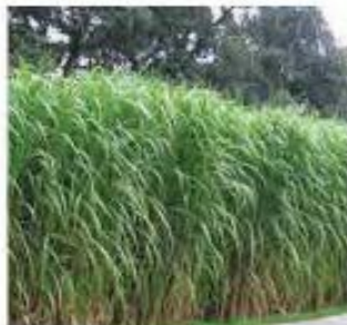
Miscanthus giganteus Miscanthus géant