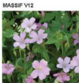
Geranium endressii Geranium