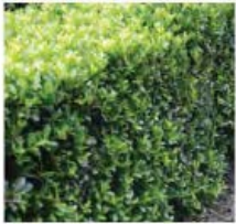
Ilex crenata Houx crénelé