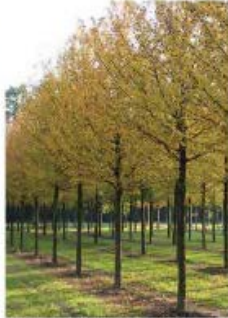
Acer campestre 'Elsrijk' Erable champêtre