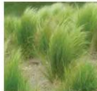
Stipa tenuifolia Cheveux d'ange