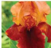
Iris barbata 'Natchez trace' Iris barbata