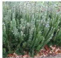
Rosmarinus officinalis Romarin