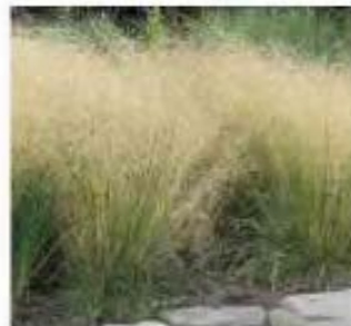
Deschampsia cespitosa Canche cespiteuse