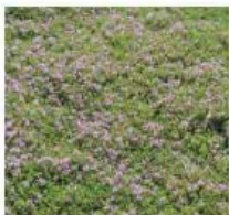
Thymus hirsutus Thym hirsute