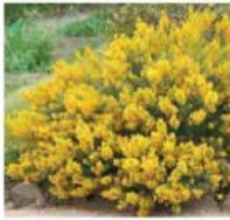
Genista tinctoria 'Plena' Genêt des teinturiers