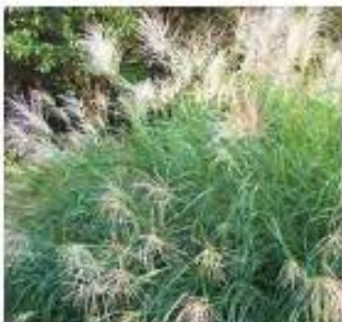
Miscanthus sinensis 'Silberfeder' Roseau de Chine