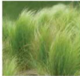
Stipa tenuifolia Cheveux d'ange