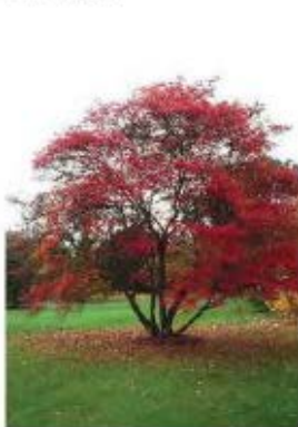
Liquidambar styraciflua Liquidambar