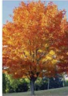
Acer cappadocicum Rubrum' Erable de Cappadoce rouge (Automne)