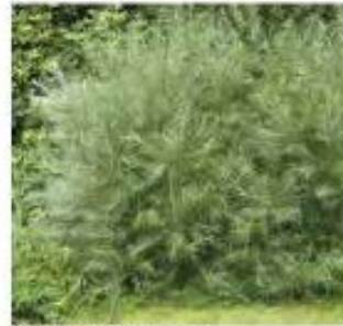
Salix rosmarinifolia Saule à feuille de romarin