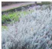
Helichrysum italicum Immortelle