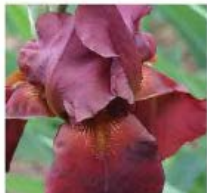
Iris barbata 'Frontier Marshall' Iris barbata