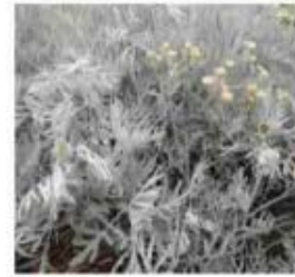
Senecio vira vira Sénéçon