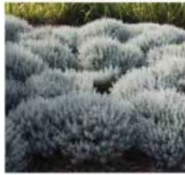
Santolina chamaecyparissus Santoline