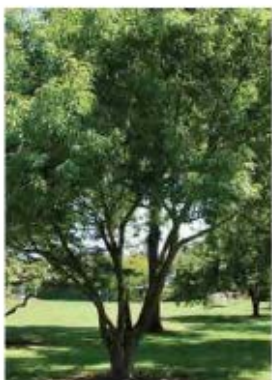
Acer monspessulanum Erable de Montpellier