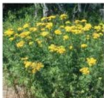
Artemisia vulgaris Armoise argentea