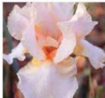
Iris barbata 'Feminine Cham' Iris barbata