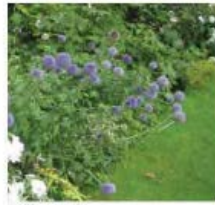
Echinops ritro Chardon boule