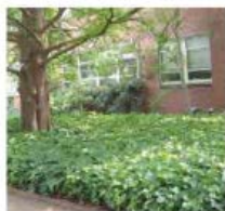
Hedera helix 'Almond'