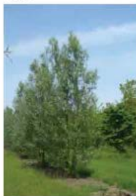
Salix alba 'Limpde' Saule blanc