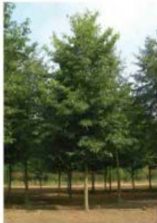
Alnus spaegthii Aulne de Spaeth