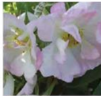
Rosa rugosa Rosier rugueux