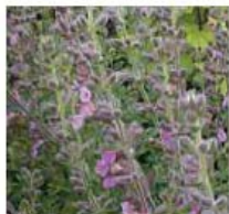
Teucrium lucidrys Germandrée