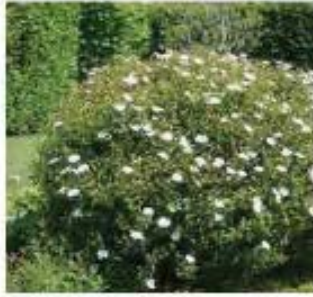
Cistus x corbariensis Cistes