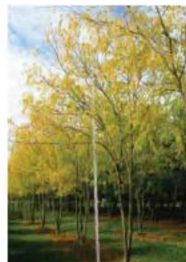
Gleditzia triacanthos 'Inermis' Févier d'Amérique (Automne)