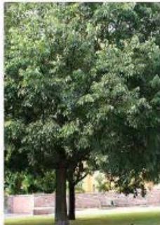
Celtis australis Mimosoulier de Provence