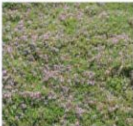
Thymus hirsutus Thym hirsute