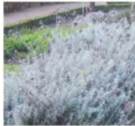
Helichrysum italicum Immortelle