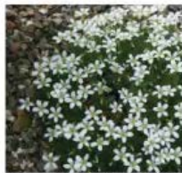
Saxifrage pedemontana 'White Alis' Saxifrage