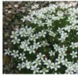
Saxifrage pedemontana 'White Alis' Saxifrage