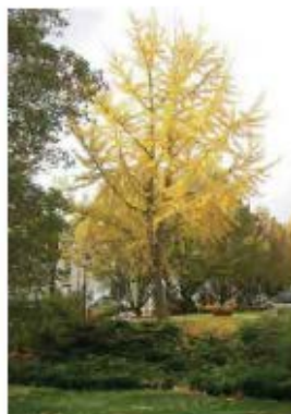
Gyngko biloba Gyngko