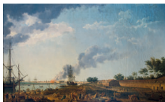
Port de Rochefort, anonyme

Vendredi 13 avril / 10h - 12h30 & 15h - 17h