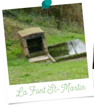
La Font St-Martin