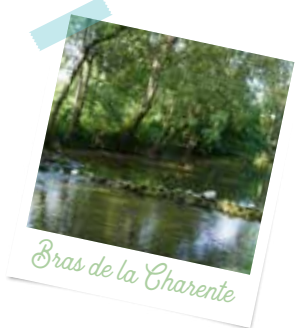
Bras de la Charente