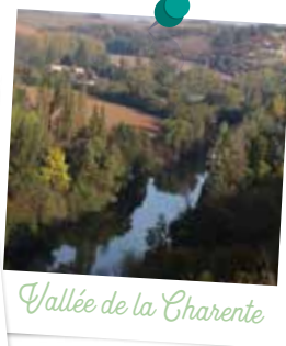
Vallée de la Charente