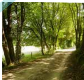
Chemin de la messe

03 - Tourner à gauche Chemin du Bac du Chien, puis emprunter le cheminement piétonnier à droite. Passer le ruisseau, poursuivre à gauche par la Rue de Verdun. Tourner à gauche pour arriver