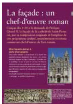
La cathédrale Saint-Pierre d'Angoulême

N'hésitez pas à nous contacter pour plus d'information ! a.paysais@grandangouleme.fr / pah@grandangouleme.fr