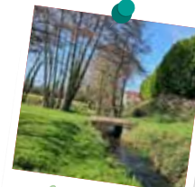
La Font Noire