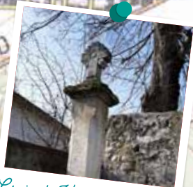
Croix du Vieux Chaumontet