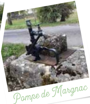
Pompe de Margnac

08 - À la sortie du chemin, suivre la route vers la droite. Avant la première maison de gauche, monter les petites marches aménagées dans le talus. Longer la muraille du logis de la Motte et arriver à une route - prendre le temps de faire un tour dans les villages de la Motte et de chez Forgeau et revenir sur ses pas. Traverser et poursuivre tout droit sur le chemin pendant 500m.