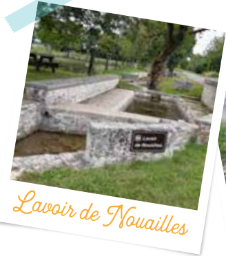
Lavoir de Nouailles