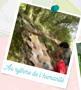
Au rythme de l'humanité