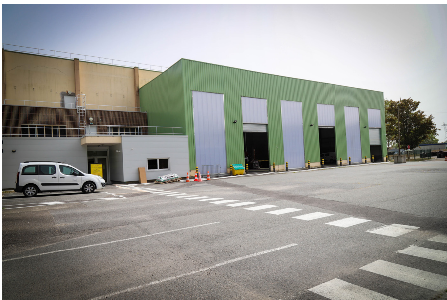
Centre technique de pré-collecte à La Couronne

Après décision de GrandAngoulême, ce site classé ICPE (installation classée pour la protection de l'environnement) est transformé en pôle logistique nécessaire au pôle « Pré-collecte » du service Déchets Ménagers, géré à 100% en régie par les agents de GrandAngoulême.