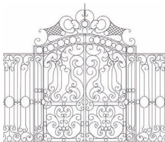
Dessin de la grille des Méricots

En 4 dates, venez participer aux visites exceptionnelles d'une chapelle aux vitraux merveilleux où la lumière de l'été vous en fera voir de toutes les couleurs ! (p.8)