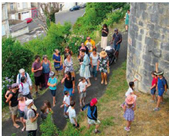
Balade commentée Il était une ville