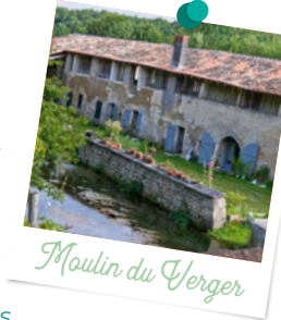
Moulin du Verger

02 - À l'intersection, prendre à droite et tourner aussitôt à droite sous les rochers . Continuer toujours tout droit dans la vallée abritant un site d'escalade de renommée mondiale. Voir le Moulin du Verger , connu pour son papier artisanal fabriqué à l'ancienne et célèbre aussi grâce à la saga de Marie-Bernadette Dupuy. Apercevez la végétation méditerranéenne caractéristique des « pelouses calcaires » de la vallée des Eaux Claires (globulaire commune, crapaudine de Guillon, sabline des Chaumes...). Franchir la barrière et continuer en ignorant tous les départs de chemins à droite et à gauche jusqu'à la route de la Vallée des Eaux-Claires que l'on emprunte vers la droite pendant 600 m.