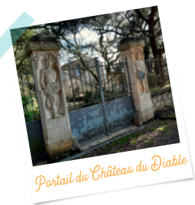
Portail du Château du Diable

03 - Monter le chemin à droite derrière la maison et rejoindre la Rue du Château du Diable que l'on suit vers la droite – voir le portail orné de sculptures de diables dans le virage et poursuivre par la route. Prendre à droite devant une maison pour arriver Place du Petit Rochefort – admirer son élégant puits daté du XVI e siècle. Poursuivre jusqu'à l'intersection et tourner à droite Rue des Grands Champs – ici, les maisons rivalisent de décorations pour les fêtes de fin d'année . Aller en face Sentier du chêne vert et obliquer à droite sur la place avant la barrière.