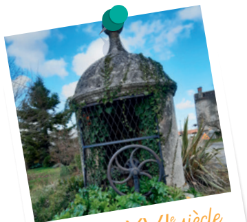
Puits du XVI e siècle