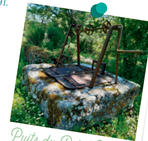
Puits du Petit Cherves

Traverser prudemment pour emprunter le chemin en face. Un second puits borde le chemin à l'entrée du Petit Cherves. Emprunter la RD 113 vers la droite.