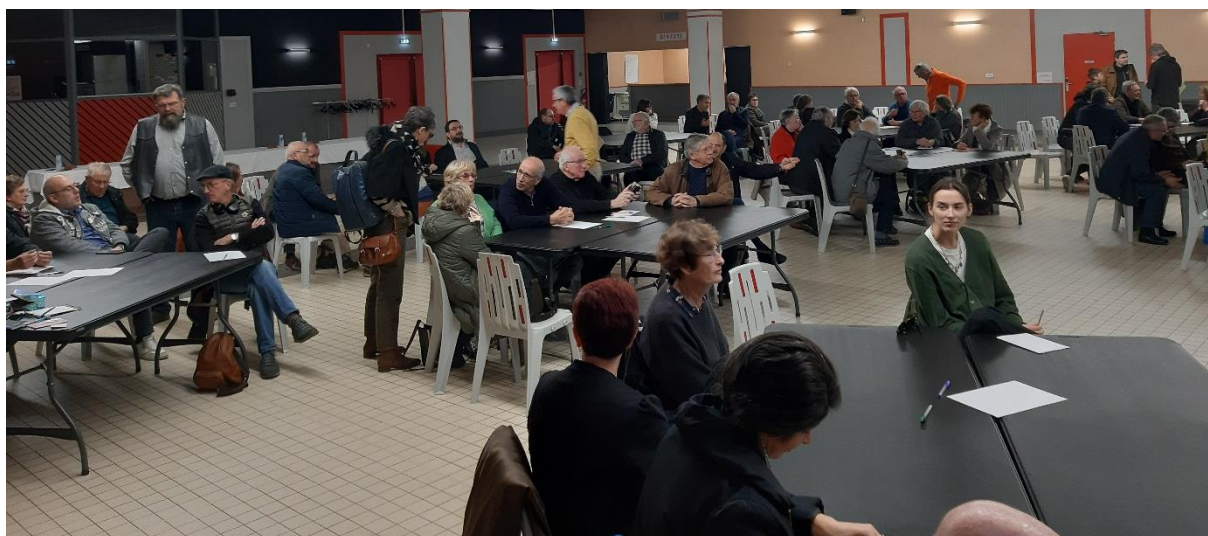
Temps d'échange entre participants avant les questions-remarques-réponses en plénière. Déc. 2024, Lisode.

L'ensemble des échanges est restitué ci-après.